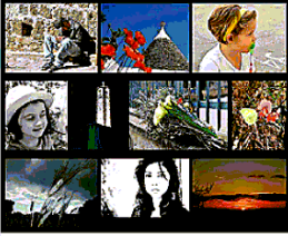
PEZZE DI GRECO, E NON SOLO...