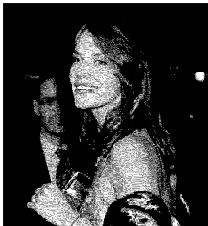
Nastassja Kinski, madrina del festival

grande cinema in Puglia. Per dieci giorni la splendida cornice salentina aprirà una finestra sul mondo del cinema "corto" accogliendo ospiti internazionali, cinema indipendente, incontri, eventi speciali e proiettando più di 100 opere. I film dei giovani registi si confronteranno, in questa edizione, con quelli dei grandi maestri del passato. Tra gli eventi speciali l'omaggio a Ugo Tognazzi, attore, regista, grande "mattatore" della commedia italiana».