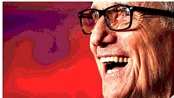
Bellocchio, 79 anni, era in gara all'ultimo Cannes con "Il traditore"

«Sì: quelli che tentano di scovare la sua prigione. Ma anche i tentativi di trattative con i rapitori».