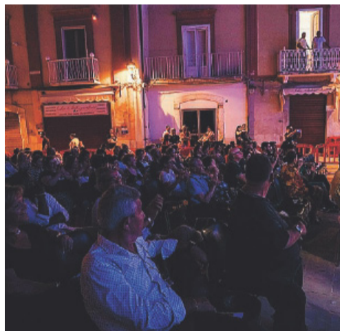
ERIKA BLANC L'attrice durante la serata a San Severo

«Mi ci sono trovata per caso. Mio padre voleva che suo-