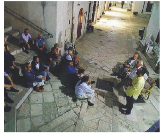
FESTIVAL DEL RIONE JUNNO Foto della scorsa edizione

● Si terrà solo a metà agosto il Festival del Rione Junno a Monte sant'Angelo, ma gli organizzatori lanciano due appelli alla cittadinanza, inviti a «costruire» e a «ospitare».